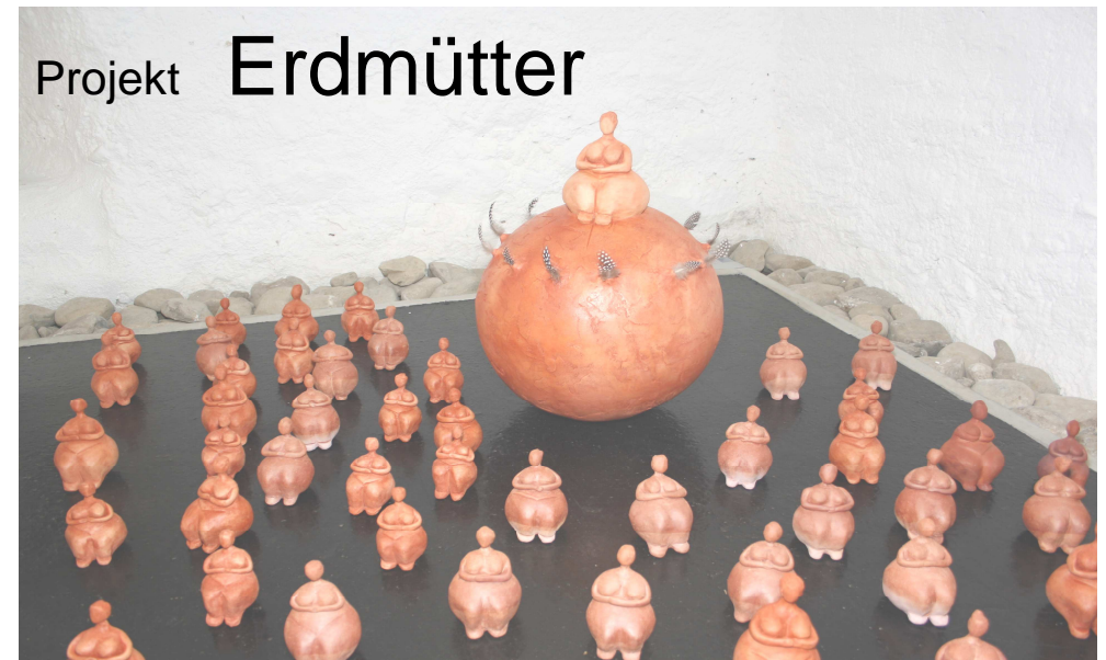
Ausstellung 2009 in der Propstei Alt St. Johann/Toggenburg CH